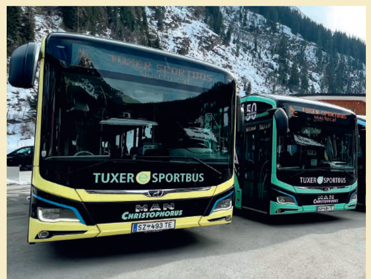
In Tux-Finkenberg sorgen Elektrobusse für nachhaltige Mobilität im ganzen Tal.

Gletscherbahnbus in Hintertux nur noch batteriebetriebene Fahrzeuge eingesetzt. Die E-Busse legen im Schnitt pro Tag etwa 300 Kilometer zurück und gewinnen durch Rekuperation beim Bremsen und Ausrollen selbst Energie zurück. „Durch die Rekuperation werden in der Spitze bis zu 250 kW elektrische Energie erzeugt, welche zurück in die Akkus fließt. Das ermöglicht die Bewältigung der teils fordernden Bergstrecken ohne Zwischenladen untertags“, berichtet Andreas Kröll von Christophorus Reisen. Nachts werden die Busse an 400 kW starken Superchargern mit Ökostrom geladen. Durch den Einsatz der E-Busse werden pro Jahr rund 450.000 Liter fossiler Dieselkraftstoff bei einer Gesamtfahrleistung von 1.050.000 Kilometern eingespart.