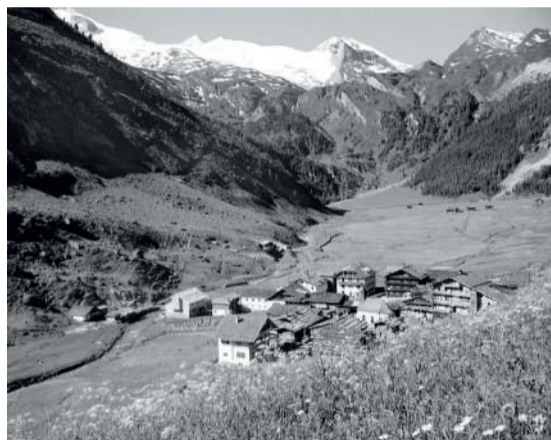
Hintertux wie es früher einmal war. Die Bilder aus der Chronik-Tux zeigen die Fraktion im Jahr 1907 (li.) und 1935 (re.).

A us historischer Sicht begannen bajuwarische Siedler nach dem Zerfall des Römischen Reiches und dem Abzug der Legionen, das Tuxertal zu besiedeln. Im Zuge dieser bis weit ins siebte Jahrhundert andauernden Landnahme gelangten auch germanisches Recht und entsprechende Verwaltungsstrukturen in den Alpenraum. Im Herzogtum Bayern zerfiel das Tuxertal in zwei Gaue. Der vordere Teil kam zum Gau Zillertal (Salzburg), der hintere Teil fiel dem Gau Wipptal zu und wurde damit Teil der Grafschaft Tirol. Der gesamte Bereich Hintertux war einer Grundherrschaft unterworfen und wurde vom Pflegamt Steinach am Brenner aus verwaltet. Dadurch entwickelten sich das vordere und das hintere Tuxertal in verwaltungstechnischen, rechtlichen, steuerlichen und kirchlichen Angelegenheiten unterschiedlich. Erst im 19. und 20. Jahrhundert wurden diese Systeme harmonisiert.