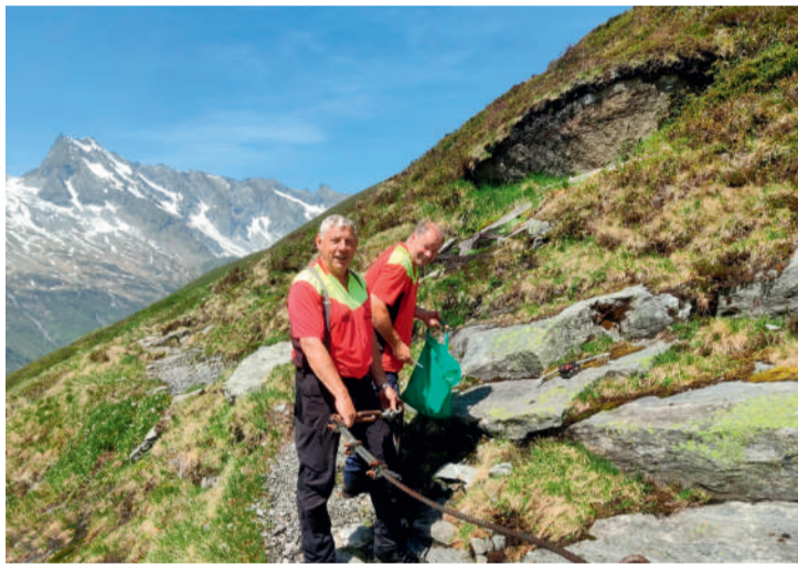
Die Mitarbeiterinnen und Mitarbeiter begehen mindestens zu zweit die Routen und dokumentieren den Zustand. In manchen Bereichen sind auch umfassende Sicherungsmaßnahmen notwendig.

GROSSES ENGAGEMENT. 2025 haben die Wege-Teams der ARGE über 1.600 Arbeitsstunden geleistet. Die Mitarbeiterinnen und Mitarbeiter begehen mindestens zu