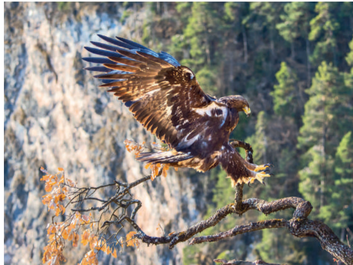
Die majestätischen Greifvögel sind nicht nur ein Symbol für Freiheit, sondern auch ein wertvoller Indikator für den Zustand alpiner Ökosysteme.