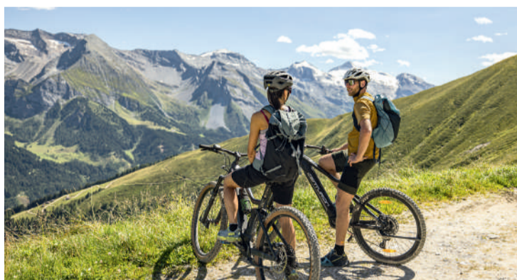
BIKE&HIKE – die Kombination aus (e-) Mountainbiken und Wandern bietet eine Möglichkeit, die Schönheit der Natur in der eigenen Geschwindigkeit zu erleben.

GRÜBLSPITZE (2.395 M). Eines der schönsten Bike&Hike-Ziele ist die Grüblspitze. Von Tux-Vorderlannersbach geht es mit dem