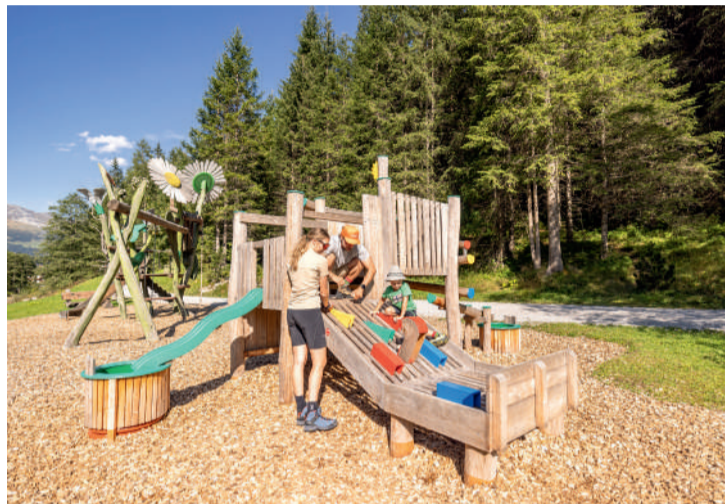
In Tux steht 2026 die weitere Verbauung des Tuxbaches im Fokus. Im Zuge der Sicherungsmaßnahmen entlang des Tuxbaches werden die TUX-Welten beim Erlebnisweg Tuxbach mit den Bergmurmelnbahnen noch attraktiver gestaltet.

Grund für die Bauaktivitäten war das Hochwasser im Tuxbach im Juli 2024, ausgelöst durch eine Gewitterzelle über dem Junsberg und Madseitberg. Insgesamt hat das Unwetter damals Schäden in Höhe von rund 2,3 Mio. Euro verursacht.