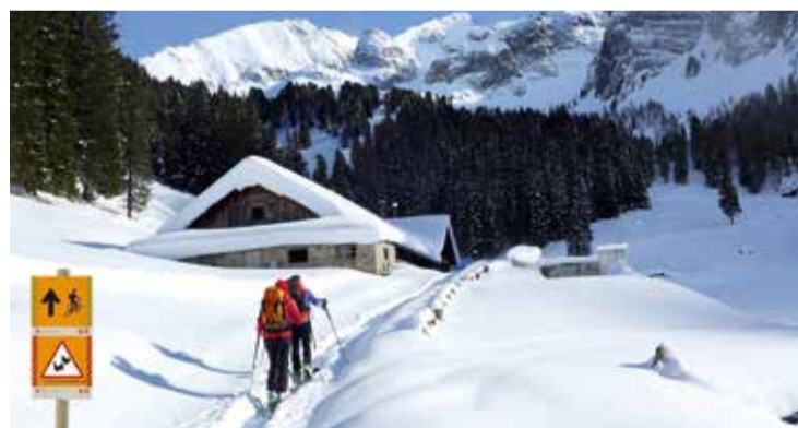
Neben den geführten Schneeschuhwanderungen von Breitlahner in den Zemmgrund zählt die Skitour von Juns über den Loschboden aufs Flach zu den winterlichen Highlights im Hochgebirgs-Naturpark Zillertaler Alpen.

D er Winter im Hochgebirgs-Naturpark Zillertaler Alpen bietet viele Möglichkeiten, die Schönheit der Berge zu erleben, etwa bei einer geführten Schneeschuhwanderung im Zemmgrund. Die alpine Winterlandschaft hält einige Überraschungen bereit, etwa faszinierende, zentimetergroße Schneekristalle. Startpunkt ist der Gasthof Breitlahner. Schneeschuhe und Stöcke werden bereitgestellt und ein bequemer Taxitransport bringt die TeilnehmerInnen von Ginzling zum Ausgangspunkt und wieder zurück. Anmeldung unter www.naturpark-zillertal.at