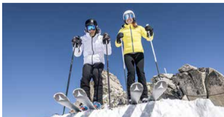
Der Hintertuxer Gletscher garantiert Schneesicherheit von Oktober bis Mai.

S chneebedeckte Berge, tiefverschneite Wälder und der schneeweiße Hintertuxer Gletscher, der über das vielleicht schönste Alpenhochtal Tirols strahlt. Das Tuxertal mit den Orten Finkenberg, Tux und Hintertux sorgt für unzählige Wintererlebnisse, die sowohl Aktive als auch GenießerInnen in ihren Bann ziehen.