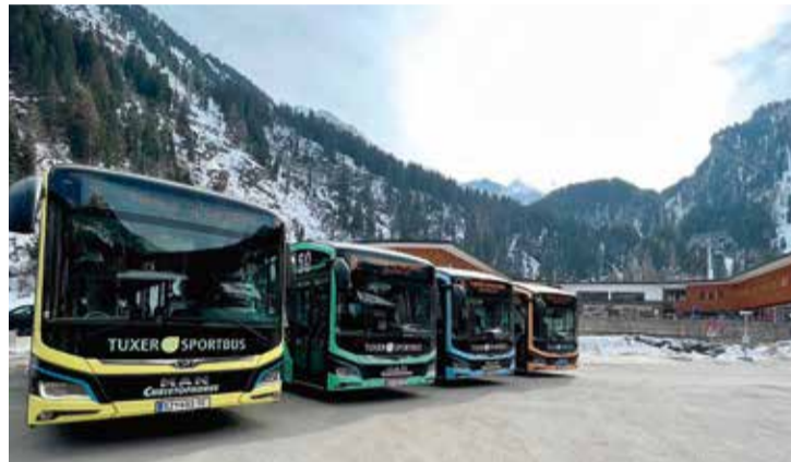
In Tux-Finkenberg sorgen Elektrobusse für nachhaltige Mobilität im ganzen Tal.

TUXER (E)-SPORTBUS. Mobilität ist mehr als reine Fortbewegung. Es geht auch um Verantwortung – für die Umwelt, für kommende Generationen und für den Erhalt der einzigartigen Naturlandschaft, die das Tuxertal so besonders macht. Im März 2023 wurden die ersten vier Elektrobusse im Tuxertal in Dienst gestellt. Seit Winter 2023/24 wird der gesamte Fahrplan des Tuxer Sportbusses mit seiner engen Zehn-Minuten-Taktung mit sieben Elektrobusen abgedeckt. Die batteriebetriebenen Fahrzeuge gewinnen durch Rekuperation beim Bremsen und Ausrollen selbst Energie zurück. Bis zu 250 kW Energie fließen so wieder zurück in die Akkus.